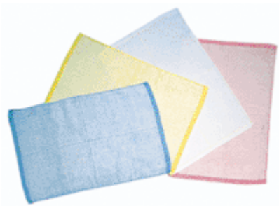
《カーウォッシューフタオル#695》