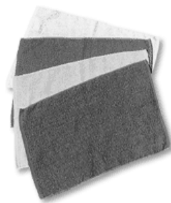
《カーウォッシュ200匁タオル#725》