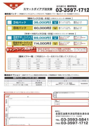
④普及型スキャンツール専用チラシ